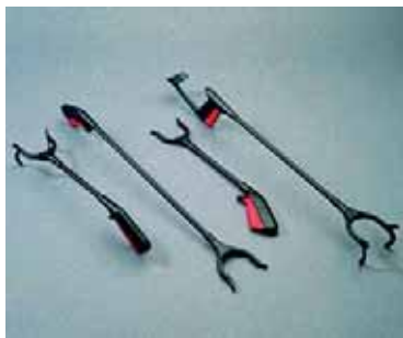
Slika 12: Pomagalo za sakupljanje stvari sa poda