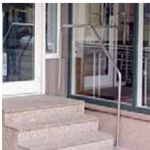
Slika 18: Rukovat uz stepenice

Primjerena procjena fizičkog okružja u kojem klijent živi je osnovica rada radnog terapeuta. Velika osoba populacije 65+ ima problema sa savladavanjem prostora u kojem živi, posebice neprilagođenog stepeništa, ulaznih vrata, ali i savladavanjem prepreka sa kojima se suočavaju kada izlaze u zajednicu. U većini slučajeva to vodi ka postupnoj socijalnoj izolaciji, ali i gubitku većine okupacija koje se provode van doma (okupacijska deprivacija).