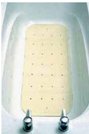
Slika 16: Protuklizna površina

ma i nesposobnostima pacijenta, edukacija i trening obavljanja aktivnosti na nov način koji ujedno čuva energiju i osigurava sigurnu provedbu aktivnosti.