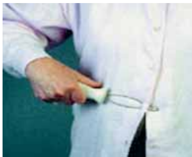
Slika 5: Drška za zakopčavanje gumba