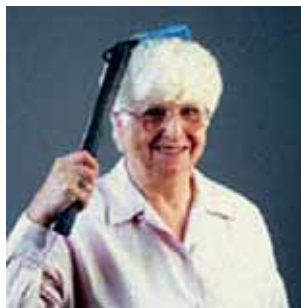
Slika 9: Pomagalo za češljanje