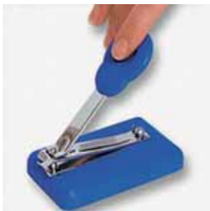
Slika 8: Pomagalo za rezanje noktiju