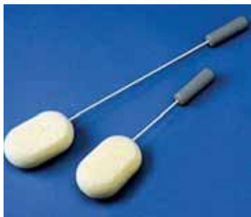
Slika 6: Pomagalo za pranje leđa