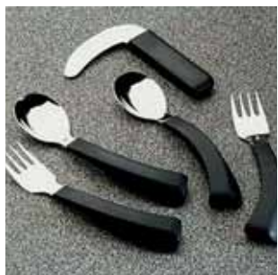
Slika 1. pribor za jelo

Poteškoće hvata koje su rezultat promjena malih zglobova šake, ograničene pronacije/supinacije ili pokreta u laktu i ramenu mogu uzrokovati primjerice probleme pri uporabi pribora za jelo ili pri držanju šalice. Vrlo često sama težina šalice može biti problem (slika 2.). Rješenje radni terapeut pronalazi u adaptaciji pribora kroz osiguravanje većeg hvata ili zadebljanja/zakrivljenja drške vilice, žlice, noža (slika 1.). Kada je хват u potpunosti izgubljen može se koristiti drška koja se pomoću čičak trake hvata za korisnikovu ruku (slika 3.).