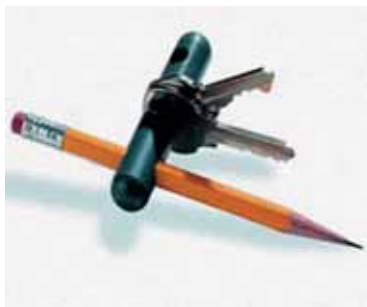
Slika 10: Pomagalo za pisanje

Radni terapeut kod problema pisanja preporuča sljedeće: zadebljana pomagala za pisanje (slika 10. i 11.). Osobe koje imaju znatno ograničenu pokretljivost ramenog zgloba mogu koristiti prije navedenu dršku za odijevanje kao pomagalo za baratanje sa prekidačima za svijetlo. Kod ostalih poteškoća može se koristiti zadebljanja ključa za lakše baratanje sa istim, prilagođene utičnice (slika 13.).