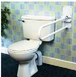
Slika 15: Rukohvat

Standardna visina WC-a će koji put biti neprimjerena kod starije osobe (specifično kada su involvirane promjene na koljenu i kuku). Nekima će trebati dodatna potpora u obliku rukohvata. Kod određenih pacijenata njega nakon mikcije i defekacije može stvarati značajne problem zbog ograničenog opsega pokreta ramena, lakta i ručnog zgloba. Samo primjerena adaptacija WC-a osigurat će njegovo sigurno korištenje. Radni terapeut sudjeluje u ergonomskoj prilagodbi istog. Iskrena komunikacija u sigurnom okružju esencijalna je za rješavanje problema obavljanja navedene aktivnosti iz osnovnog razloga što je pacijentima vrlo teško i neugodno razgovarati o toj temi.