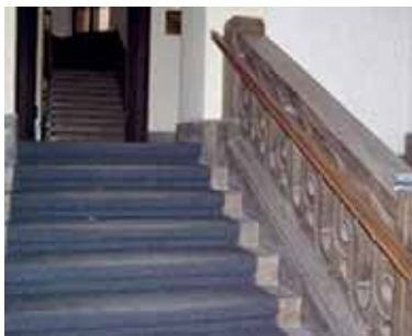
Slika 19: Rukovat uz stepenice