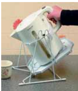
Slika 2. Adaptirano pomagalo