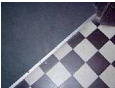
Slike 21: Naglašavanje prelaska iz prostorije u prostoriju