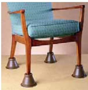
Slika 14: Podizači za stolce

Većina stolaca koji se uporabljaju u svakodnevnom životu su premekana i preniska za osobu starije životne dobi, te ih isti pokušavaju prilagoditi na način da postavljaju dodatne jastuke na sjedalo. No, navedeni način s jedne strane povećava mogućnost pada i značajno otežava pridizanje. S druge strane kod dugotrajne uporabe tako prilagođenog stolca pri pridizanju osoba stvara zalet naginjući se naprijed i natrag što dodatno može utjecati na pogoršanje stanja zglobnih tijela. Radni terapeut kroz intervenciju educira korisnika o ispravnom načinu sjedenja (pozicioniranje na način da je položaj kuka i koljena 90^\circ , sa stopalima na podu), te preporuča ergonomsku prilagodbu stolca u skladu s ekonomskom situacijom korisnika (slika 14.).