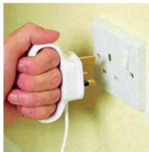
Slika 13: Prilagođena utičnica