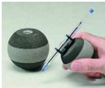
Slika 11: Pomagalo za pisanje