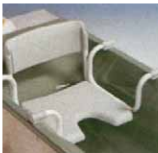
Slika 17: Sjedalica za kadu