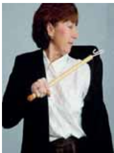
Slika 4: Drška za odijevanje

vaju njihovu uporabu su: drška za odijevanje (slika 4.), žlica za oblačenje cipela sa produženom drškom, pomagalo za oblačenje čarapa, drška za zakopčavanje gumba (slika 5.). Radni terapeut također može korisniku preporučiti odjeću koja je lakša za odijevanje.