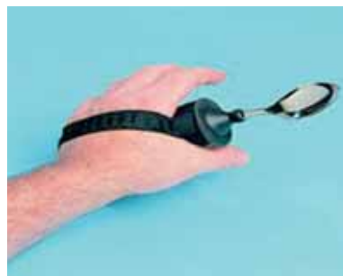
Slika 3. Adaptirano pomagalo