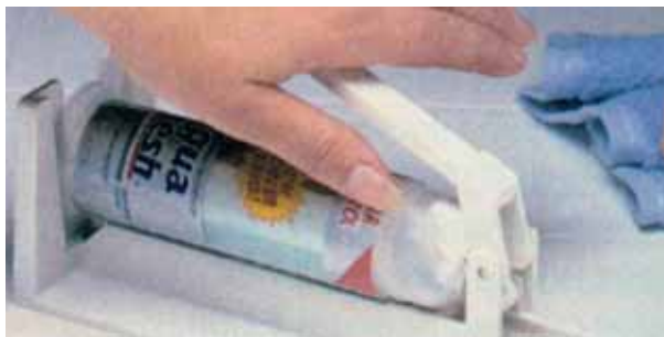
Slika 7: Pomagalo za istiskivanje paste za zube